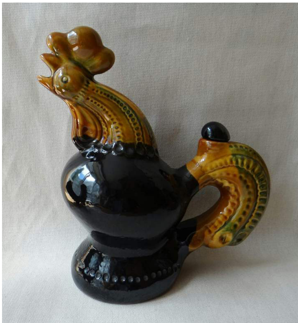
Il. 21. Kogut wasylkiwskij jako symbol [ https://kp.ua/ua/life/a649004-pivnik-iz-borodjanki-joho-stilistika-novij-dizajnerskij-na-toj-chas-pidkhid-a-ne-stara-stalinska-shkola ].