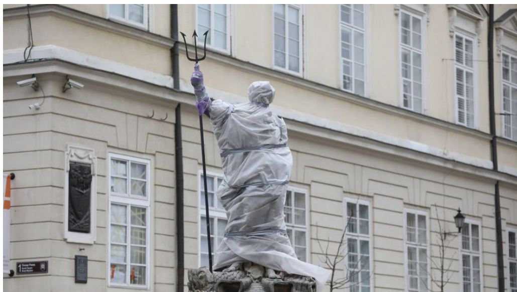
Il.7. Sposoby zabezpieczenia rzeźb na fontannach w Rynku, Lwów, marzec 2022 rok.