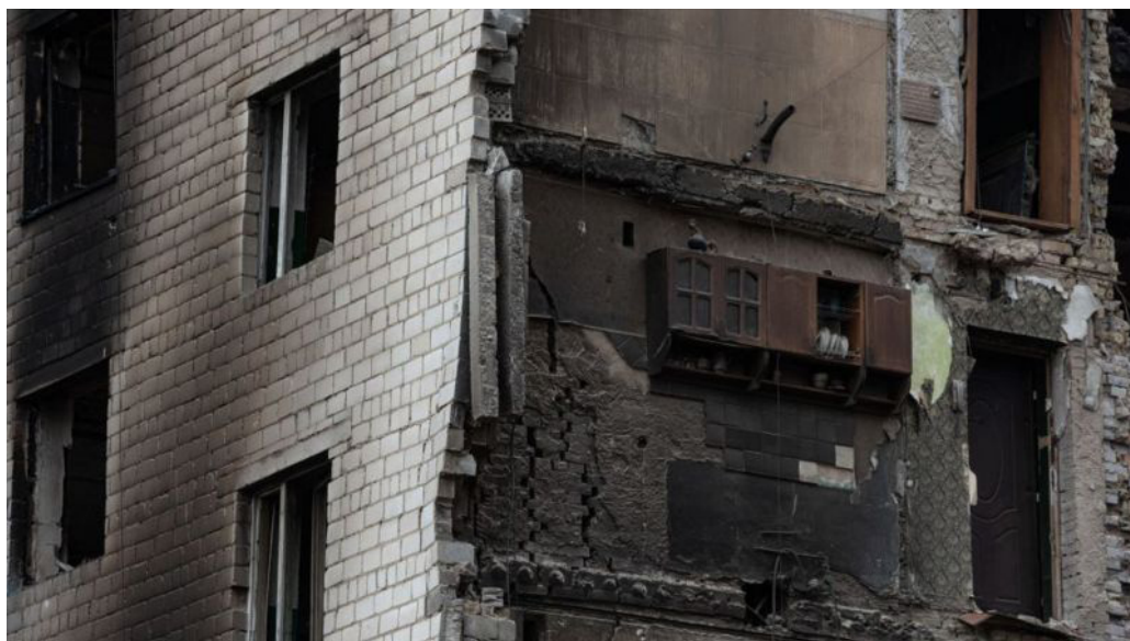
Il. 20. Szafka i kogut jako symbol niezłomności Ukraińców; Borodianka, po inwazji wojsk rosyjskich, Autorka – Yelisaveta Servatinska (Єлисавета Серватинська), 2022 rok [https://www.bbc.com/ukrainian/news-61059744].

Wkrótce znaleziono właścicieli tego mieszkania, i odpowiednio, słynnej szafki z kogutem. Za ich zgodą meble zostały zdemontowane i przekazane do Narodowego Muzeum Rewolucji Godności jako eksponat muzealny 40 .