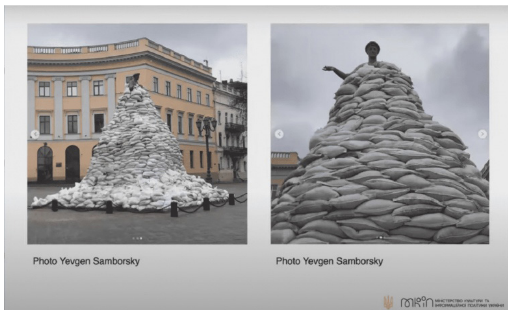
Il.8. Sposoby zabezpieczenia pomnika Duka de Richelieu za pomocą worków z piaskiem, Odessa, marzec 2022 rok.