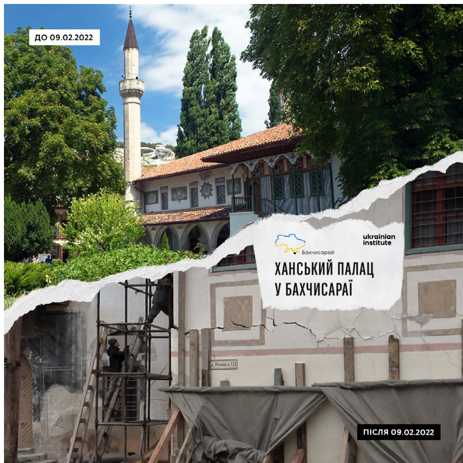
Il. 1. Pałac chana w Bachczysaraju (в Бахчисараю) na Krymie jako przykład dzieła architektury krymsko-tatarskiej. Zdjęcie przed 9.02.2022 r. i po 9.02.2022 r.

Inwazja 24 lutego 2022 roku okazała się bardziej tragiczna dla ukraińskich muzeów. Muzea (narodowe, lokalne, prywatne) stały się celem zarówno grabieży, jak i dewastacji 5 . Lista jest codziennie aktualizowana 6 . Pod tym względem bardzo ważny jest projekt Pocztówki z Ukrainy (Листівки з України), zapoczątkowany przez Ukraiński Instytut. W ramach projektu zgromadzono ponad 380 obiektów kultury, pokazując je przed i po zniszczeniu. Oprócz porównawczych zdjęć przedstawiono historię każdej placówki, jej osobliwości jako zabytku architektury czy kolekcji muzealnej 7 .