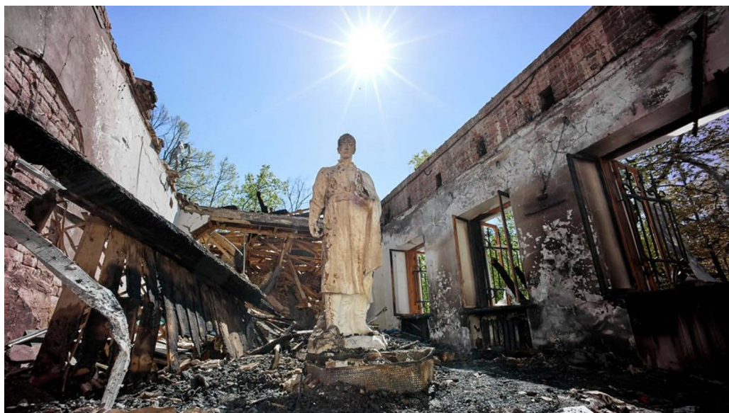
Il. 5. Pomnik Hrygoriju Skoworodi – to, co pozostało po Muzeum-memoriale Hrygorija Skoworody w obwodzie charkowskim po ataku rosyjskim; zdjęcie Sergija Kozłowa (Сергій Козлов), maj 2022 rok [ https://suspilne.media/236846-ce-varvari-rosijski-okupanti-zrujnuvali-muzej-skovorodi-jogo-obicaut-vidnoviti/ ].

Problem gotowości do ewakuacji zbiorów ukraińskich instytucji muzealnych (również archiwalnych, bibliotecznych) i ich zbiorów nadal zostaje ważną kwestią. Wojna zaskoczyła nie tylko muzea prowincjonalne. Ani odpowiednie ministerstwo Ukrainy, ani dyrekcja większości muzeów nie