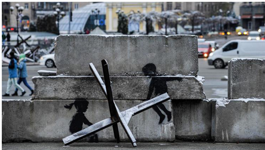
Il.14. Graffiti Banksy’ego na Chreszczatyku, Kijów, 2022 rok [ https://focus.ua/uk/culture/537713-sem-graffiti-benksi-v-ukraine-kakoe-poslanie-zashifroval-hudozhnik ].

Próbowano ukraść prace Banksy’ego: wyciąć fragmenty graffiti ze ściany budynku. W celu zachowania dzieł słynnego artysty pozostałe prace są pokryte przezrystym materiałem i podłączone do czujników reagujących na ruch i dotyk. Planowano przenieść je do muzeum 19 .