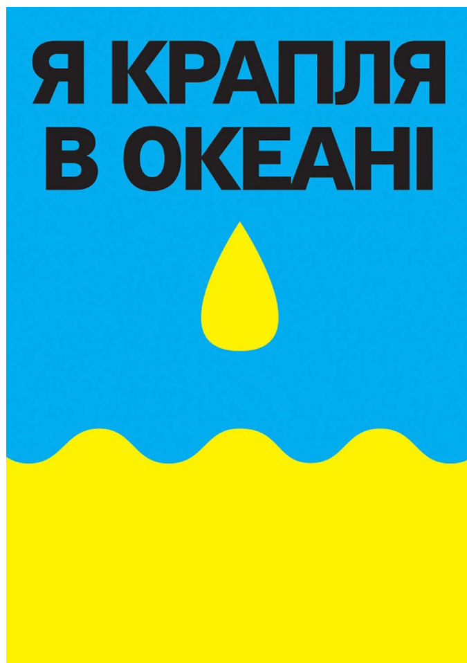
Il. 10. Plakat Ja – kropla w oceanie (Я – крапля в океані), 2014 rok [ https://www.arthuss.com.ua/books-blog/yak-ukrayintsi-vyrazhayut-svoju-pozyty-siyu-u-plakatakh-2 ].