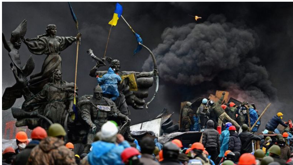
Il. 9. Majdan, 23.02.2019 r.

Może wtedy, kiedy w latach 2013–2014 pojawił się pomysł o stworzeniu Muzeum, inicjatorzy myśleli, że zapełnienie Muzeum przedmiotami z Euromajdanu – ostatecznie nie będzie kontynuowane. W marcu 2014 roku miała miejsce pierwsza inwazja Rosji na Ukrainę; 8 lat później kolejny atak (tym razem na pełną skalę, brutalny, morderczy) ponownie, niestety, otworzył zbiory muzeum na nowe eksponaty...