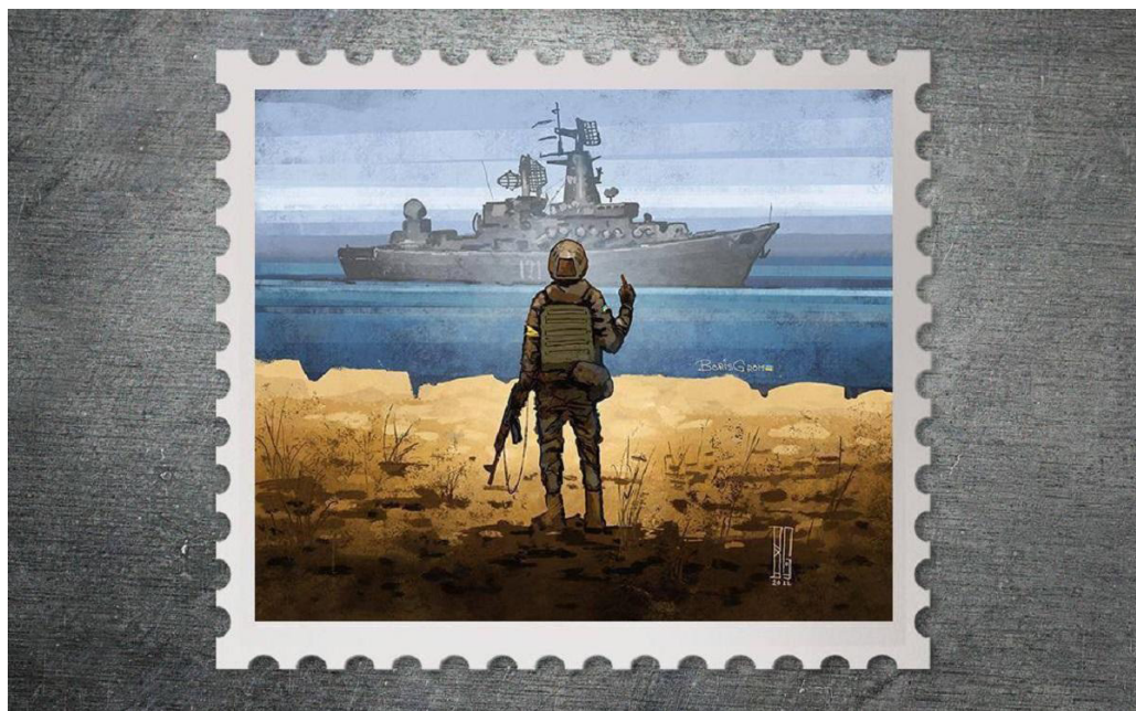
Il. 16. Znaczek „Rosyjski wojenny okręt, idź...” („Ruskij wojennyj korabl, idi...!”), Autor – Borys Groch (Борис Грох); 2022 rok [ https://www.unian.ua/society/marka-russkiy-voyenniy-korabl-znovu-u-prodazhu-ukrposhta-novini-ukrajini-11816454.html ].

W 2022 roku ten znaczek uznano za najlepszy na całym świecie. W lipcu 2023 roku dostał Grand Prix Międzynarodowej Nagrody Filatelistycznej „Aziago” we Włoszech, pewnego rodzaju Oscar w tej dziedzinie.