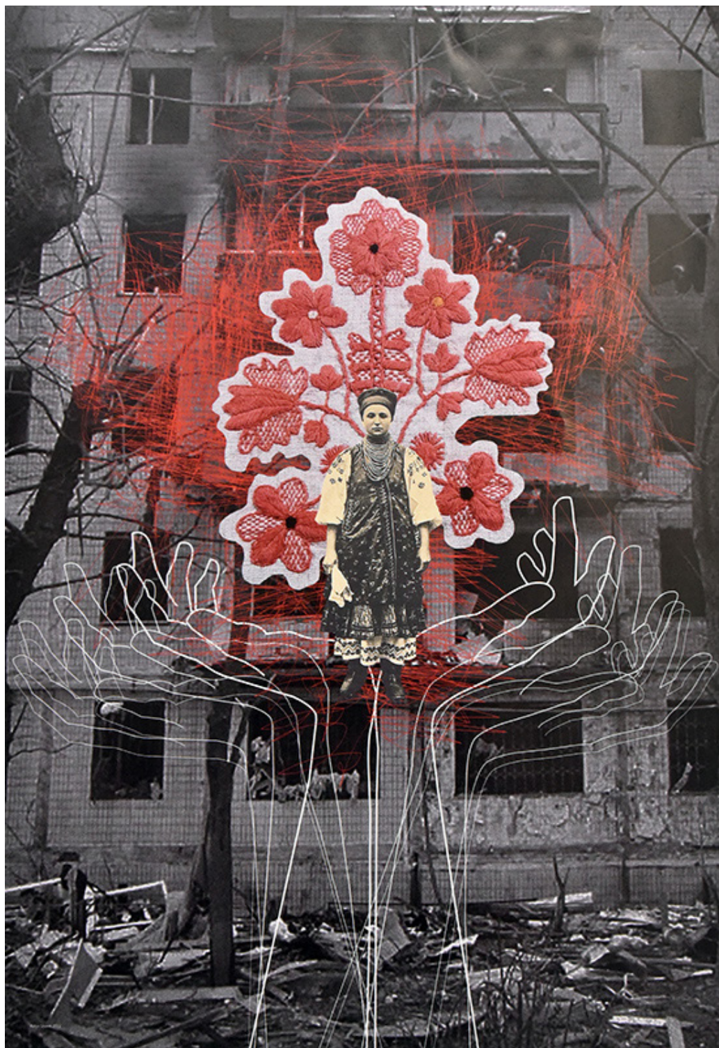
Il. 11. Kolaże z serii Moc pamięci , Autorka –Katia Lisowa (Катя Лісова); 2022 rok [ https://tripandtrek.com/Gallery/all/ukraine-modern/ukraine-modern-16.php ].