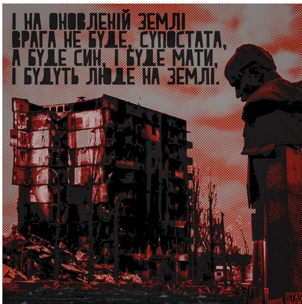
Il.12. Pomnik Kobzarza (Tarasa Szewczenki) w Borodiance po ataku rosyjskich wojsk, 2022 rok

Graffiti. Jednym z rodzajów sztuki ulicznej street art jest graffiti, interpretowane przez społeczność na różne sposoby: od wandalizmu po oryginalne i cenne dzieła twórcze. Wśród wizualnych manifestów Majdanu słynne stało się patriotyczne graffiti Ikony Rewolucji powstałe w czasie Rewolucji Godności. Szablony graffiti opatrzone zostały wizerunkami Tarasa Szewczenki (Тараса Шевченка), Łesi Ukrainki (Лесі Українки) i Iwana Franki (Івана Франка). W rolach rewolucjonistów pojawiły się na ścianie jednego ze sklepów na ulicy Hruszewskiego 10 lutego 2014 roku podczas wydarzeń na Majdanie. Pod każdym z portretów umieszczono cytaty z prac tych uznanych osobistości: „Ogień nie pali zaciekłych” („Огонь запеклих