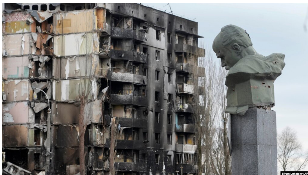
Il.19. Zdjęcie zniszczonego pomnika Tarasa Szewczenki (Kobzara, Kobziarza) w Borodiance po inwazji wojsk rosyjskich, 2022 rok [https://www.radiosvoboda.org/a/news-benksi-borodianka-maliunok/32127234.html].

Innym borodiańskim symbolem stał się kogut wasylkowski: ceramiczna figurka-dzban ze zburzonego mieszkania, a dokładniej – kuchni, zniszczonej w jednym z bloków mieszkaniowych w wyniku rosyjskich ataków rakietowych. Właśnie po kolejnej serii ataków w mediach społecznościowych pojawiło się bardzo symboliczne zdjęcie. Pomimo tego, że większość bloku zniszczono, na ścianie wisiała jednak szafka kuchenna z naczyniami, na której stał ceramiczny kogut 39 . Na tle zniszczeń i ludzkich tragedii ta szafka z kogutem – zakurzona, brudna, ale ocalała – stała się kolejnym symbolem stabilności i niezłomności Ukraińców w czasie wojny.