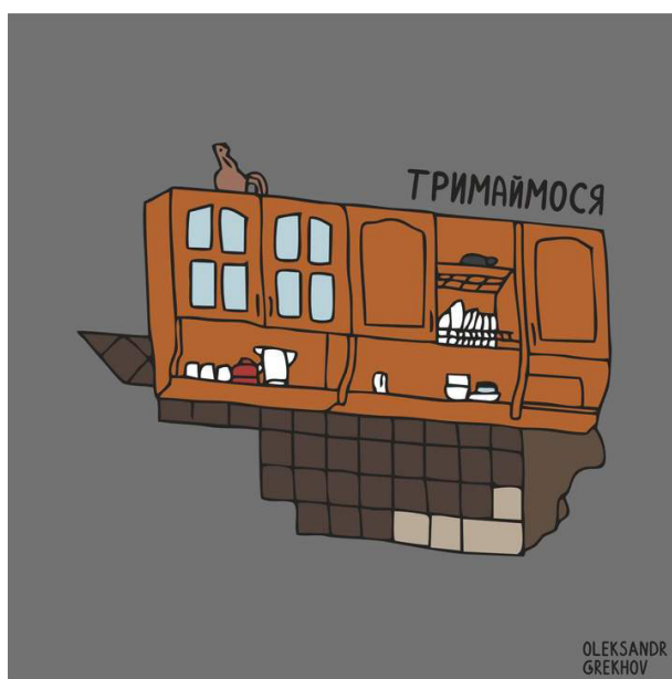
Il. 21. Wizualizacja graficzna szafki i koguta z Borodianki jako symbolu niezłomności, Autor – Aleksander Grechow (Олександр Грехов), 2022 rok [https://www.bbc.com/ukrainian/news-61059744].