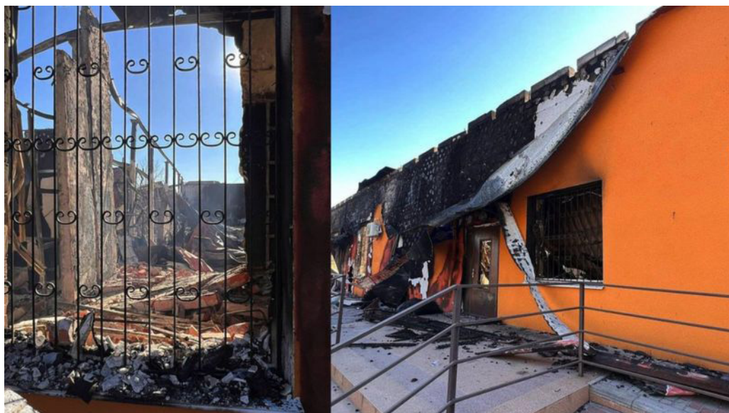
Il. 4. Iwankowskie Muzeum Historyczno-Krajoznawcze, gdzie było 25 (?) obrazów Marii Prymaczenko; [ https://www.bbc.com/ukrainian/features-61472927 ].