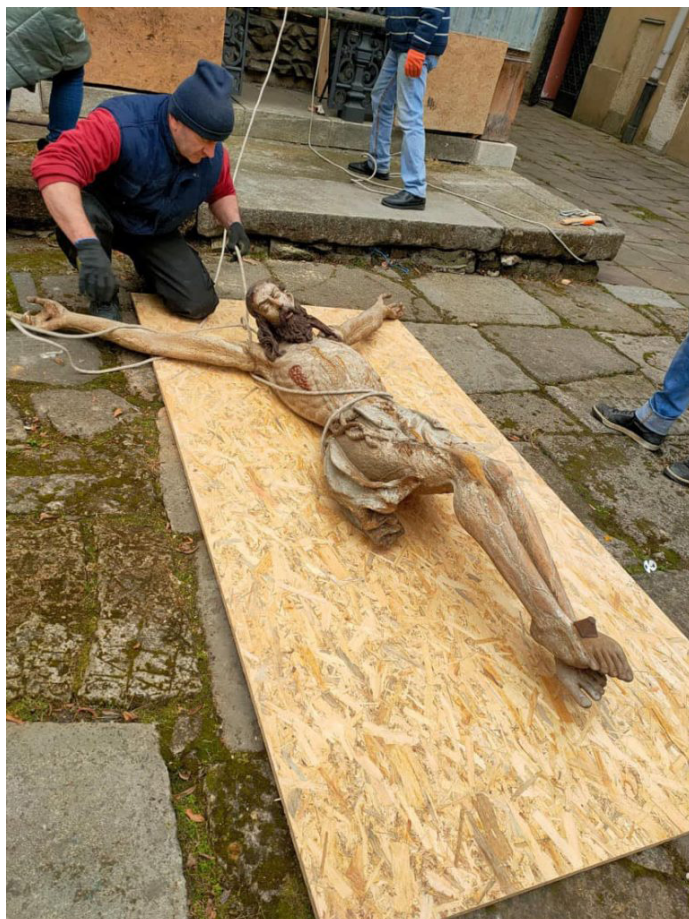
Il.6. Proces przemieszczenia rzeźby Chrystusa Ukrzyżowanego do specjalnych schronów w podziemiach, Lwów, marzec 2022 rok.

była gotowa do ewakuacji. W pewnym stopniu nieprzygotowanie przejawiało się także na poziomie psychologicznym: nikt nie wierzył w możliwość wojny na pełną skalę. W czasie inwazji dla pracowników kultury nie było scentralizowanych i wstępnie zatwierdzonych planów ewakuacji dzieł sztuki 12 . Nawet wybór najważniejszych eksponatów był niezwykle trudny. Nie było też wystarczającego zabezpieczenia ich transportu, jak i możliwości bezpiecznego transportowania 13 .